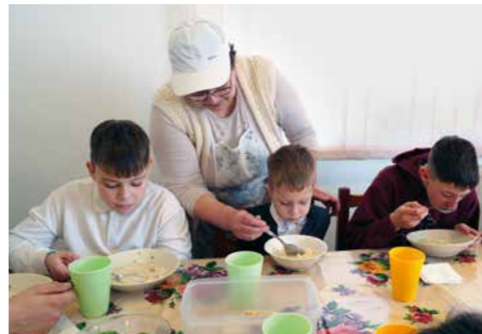
Die warme Mahlzeit spielt im Sozialen Zentrum der Ordensgemeinschaft für die 30 Kinder, die hier über Mittag betreut werden, eine wichtige Rolle. Zu Hause würden viele kein Mittagessen bekommen.