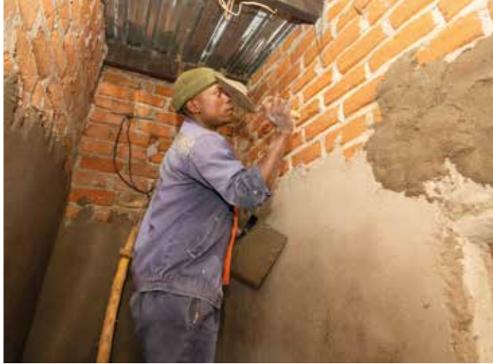
Die gezielten Wände werden alle verputzt. Hier entsteht ein neues Haus in Metarica für eine Familie mit neun Kindern.