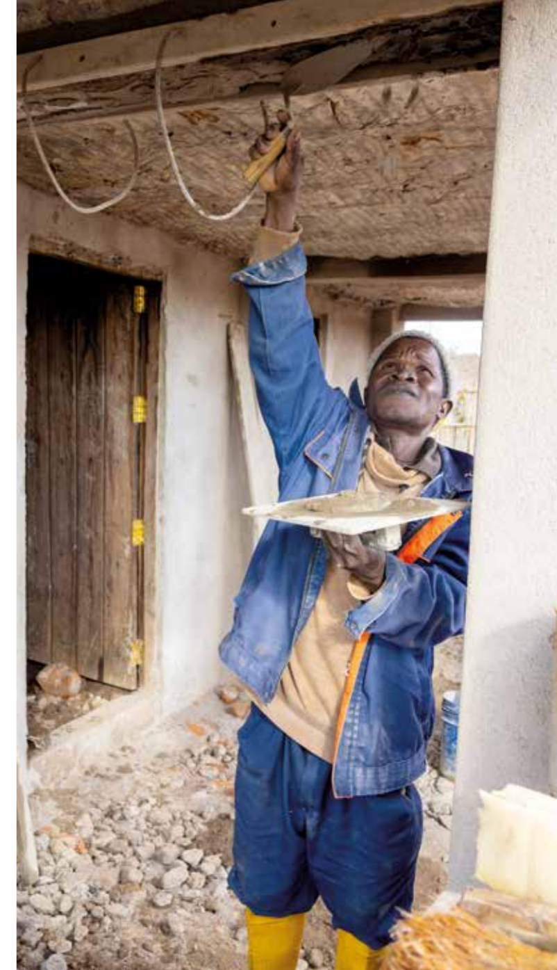
Für den Bau der Häuser werden handwerklich begabte und erfahrene Männer beschäftigt. Auch sie und ihre Familien profitieren daher von dem Projekt.

Schließlich achten Schwester Leila und Schwester Argentina auch darauf, dass alle Familien einen kleinen Garten anlegen, wenn sie ihr Haus bezogen haben. Das nimmt sie in die Pflicht, für ihr neues Eigentum zu sorgen und das auch nach außen hin erkennbar zu machen. „Wir besuchen die Familien nach