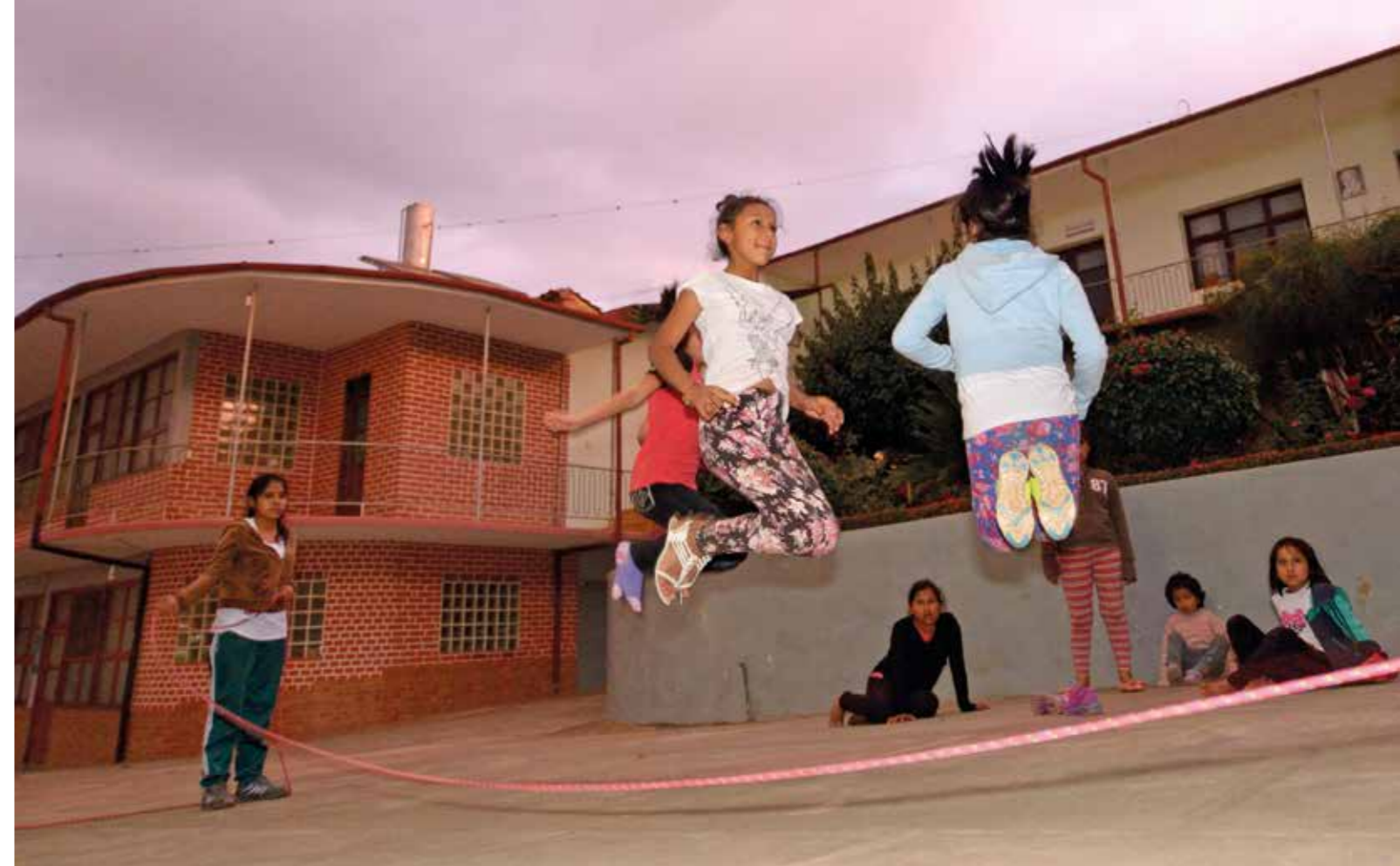
Jüngere Mädchen treffen sich am späten Nachmittag für Spiele im Hof des Kinderheims und Ausbildungszentrums Aniceto Solares in Vallegrande.