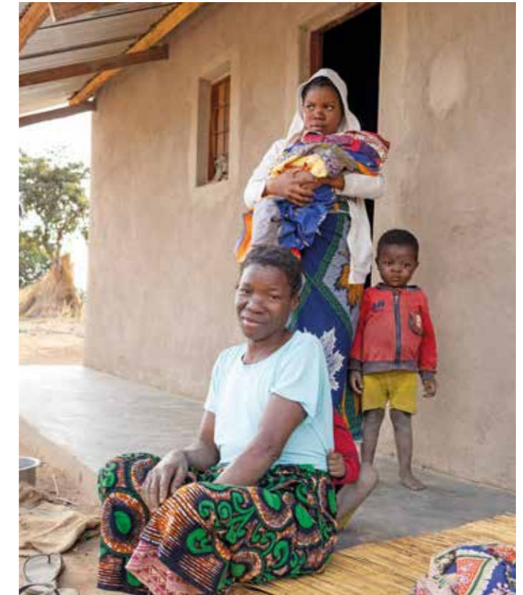
Auch diese Familie freut sich über das neu gebaute Haus.

die Solidarität in der Nachbarschaft. Mittlerweile sind über 30 dieser Häuser fertiggestellt. Für Mosambikaner unerschwinglich, aber aus deutscher Perspektive günstig, kostet eines davon nur 5000 Euro. Schwester Leila ist überzeugt: „Wir werden noch viele davon bauen.“