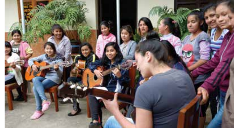
Auch das Haus Santa Susana hat seine eigene Musikgruppe. Die Mädchen singen und spielen auf Veranstaltungen und sorgen für die musikalische Begleitung der Messen in der benachbarten Kirche.