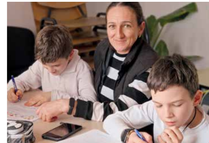
Nachmittags gibt es im Sozialen Zentrum Freizeitangebote und Hilfe bei den Hausaufgaben.