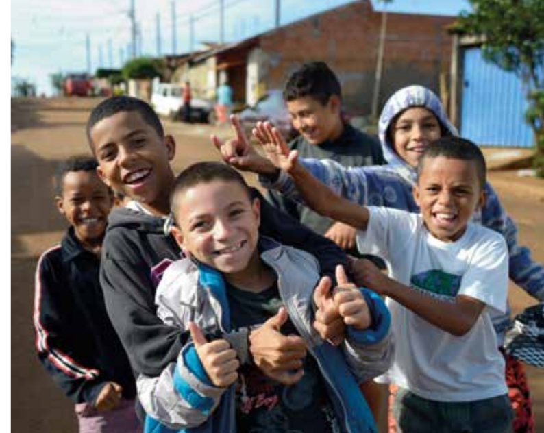
In den Stadtrandvierteln von Leme spielen die Kinder auf den Straßen.

Zusammen mit zehn seiner Studierenden machte er sich daran, den Garten umzugestalten. Professor Storto legte mit ihnen ein Bewässerungssystem an und schützte die Beete mit Netzen gegen zu starke Sonneneinstrahlung. So entstanden zwei insgesamt 800 Quadratmeter große Beete, in denen seitdem unter anderem Kohl, Tomaten, Salat, Zwiebeln, Bohnen und Kartoffeln angebaut werden. Inzwischen wird ein Großteil davon an Lebensmittelhändler weiterverkauft, um mit dem Gewinn die Angebote in den sozialen Zentren zu finanzieren. Ein kleiner Teil wird im eigenen Klosterladen angeboten. Diejenigen, die im Garten mitarbeiten, erhalten ebenfalls einen Anteil. Eine Solaranlage auf dem Dach des Altenheims Recanto Placida trägt mittlerweile erheblich zur Finanzierung der Arbeit in den eigenen Einrichtungen bei. Die Investition von 40.000