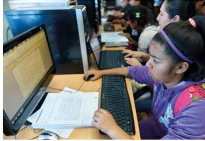
Konzentriert nimmt dieses Mädchen aus dem Kinderhaus Aniceto Solares am Informatikunterricht im Ausbildungszentrum teil.